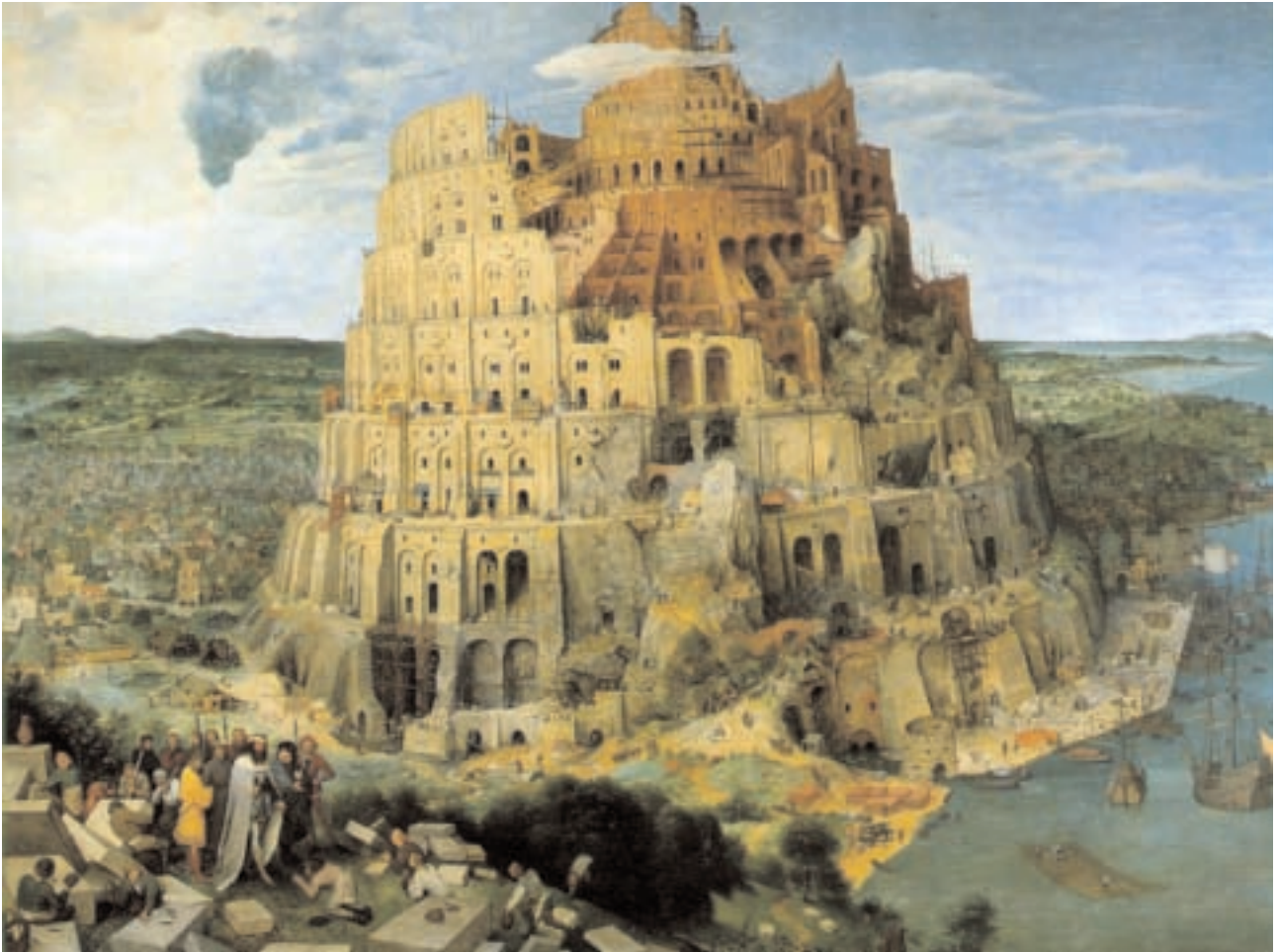
Peter Bruegel l'Ancien, La Tour de Babel («La Grande Tour»), 1563 huile sur bois 114 x 155 cm, Vienne, Kunsthistorisches Museum