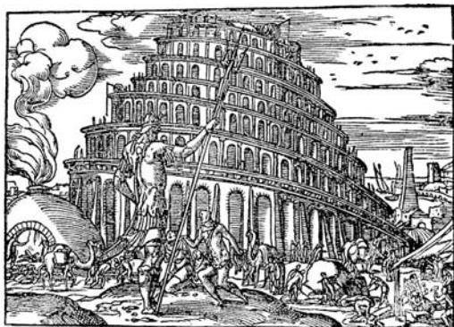
Bernard Salomon, Figure del Vecchio Testamento , Lyon, Jean de Tournes, 1554

à gauche aux tailleurs de pierre à droite – mise en regard fondamentale dont on saisira bientôt toute l'importance :