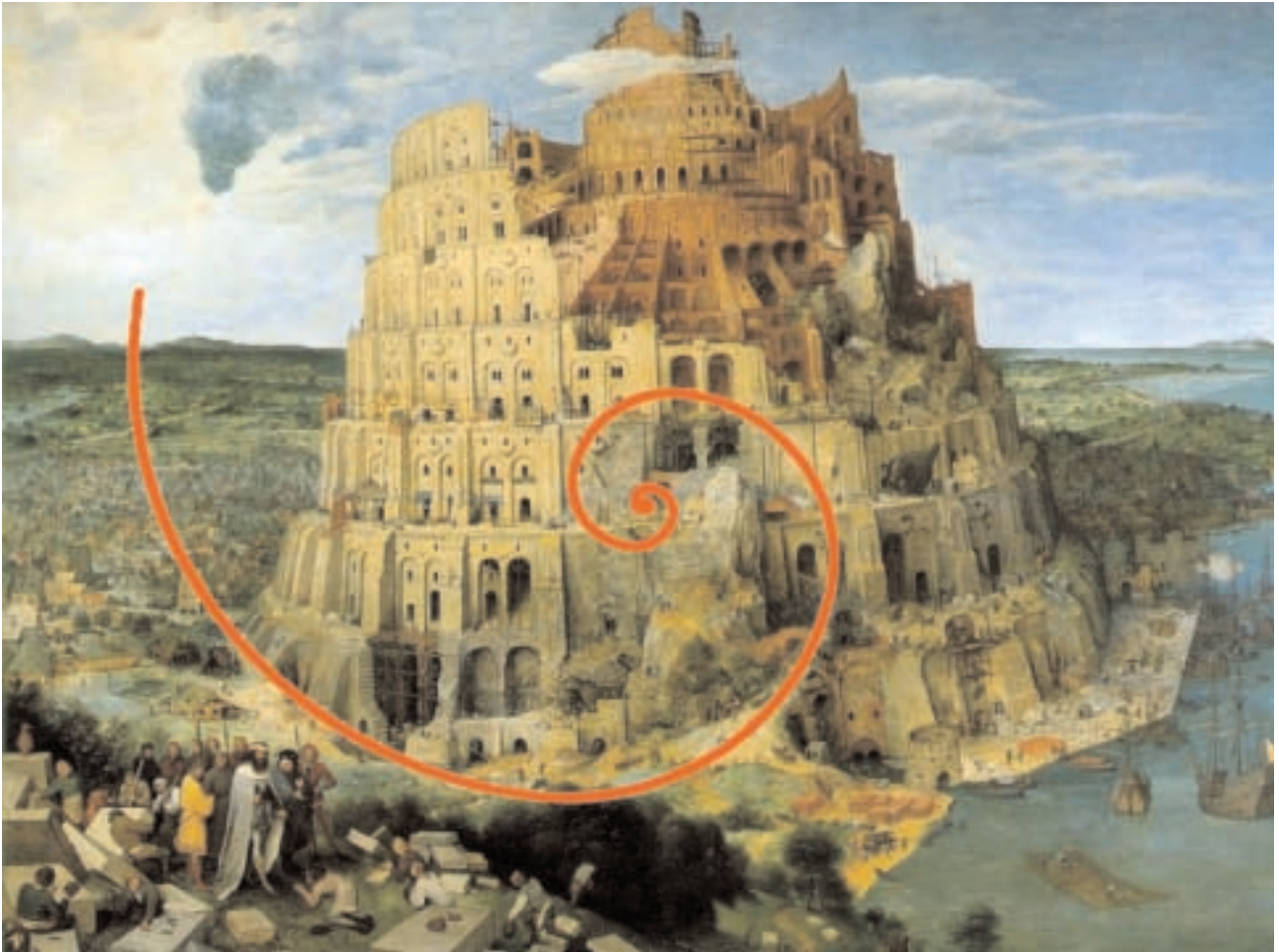
La spirale inscrite dans « La Grande Tour » (voir Éric Lysøe, « Babel ou la violence du Père »)