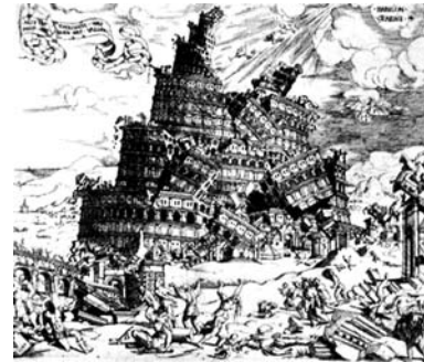
Cornelis Anthonisz, Toren van Babel , gravure sur métal, 1547

En 1547, le Flamand Cornelis Anthonisz propose une vision plus remarquable encore ; un empilement de structures circulaires s'effondre au désespoir des ouvriers :