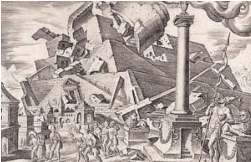
Philip Galle, Histoire de la tour de Babel 1558 gravure sur cuivre, 34,2 x 42,1 cm Berlin, Kupferstichkabinett