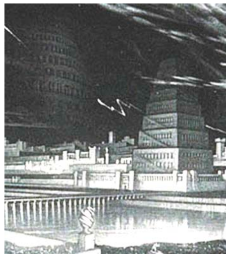
John Martin, The Fall of Babylon , détail

d'eau, pendant que des éclairs zèbrent le ciel. Dans l'arrière-plan se dresse une ziggourat conforme aux représentations qu'en donne l'archéologie moderne. Mais on distingue à ses côtés une tour infiniment plus grande, construite sur le plan circulaire cher à Bruegel :