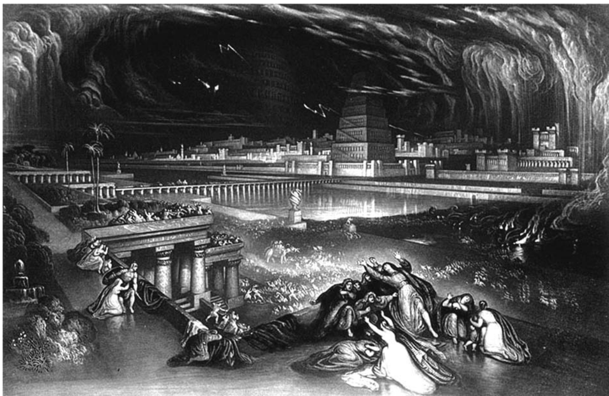
John Martin, The Fall of Babylon , 1835, eau-forte et mezzo-tinto, 18,8 x 29,9 cm, gravure tirée des Illustrations from the Bible , Université du Kansas, Letha Churchill Walker Memorial Art Fund